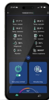
Lihtne juhtpaneel ja mobiiliäpp telefonis